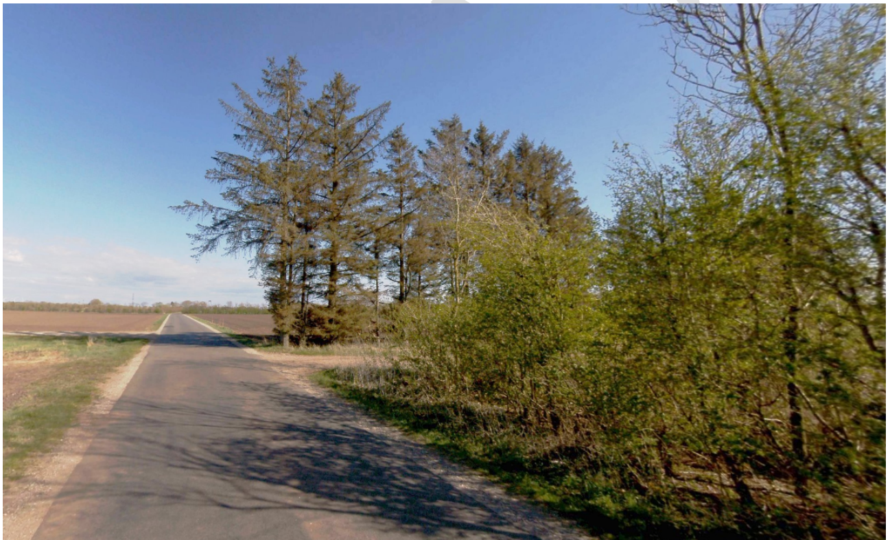
Foto: Foto fra Astrupvej. Markvej og indkørsel til gyllebeholderen ses til højre for asfaltvejen.

Øst for gyllebeholderen vil der blive plantet afskærmende beplantning. Beplantningen skal bestå af egns-karakteristiske træer og buske. Ny og eksisterende beplantning skal vedligeholdes, så det bryder indsigtslinjer til gyllebeholderen.